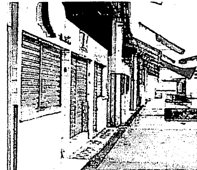
Boxes do Mercado da Liberdade estaríam sendo comercializados

Em audiência pública, funcionários denunciaram o abandono geral dos mercados da capital