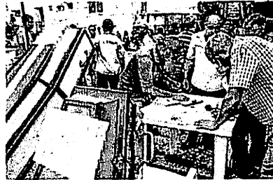
Trabalhadores da Caema fizeram "funeral" dos seus superiores

Outro ponto levantado pelos manifestantes refere-se ao número de ca-